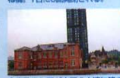
帝政ロシアが中国の大連に建てた当時の建築物を模した国際友好記念図書館(右)と、明治45年に建てられた旧門司税関(左)。門司港レトロの中心的存在だ。

「ホテル業務をひと通り経験したあと、海外での資材の買い付け、飲食店の出店企画、商業ビルのコーディネイトなど、いろんな体験を積み重ねてきました。そうしたノウハウを活かして、2年あまり前にオープンしたのがCoco Cafeなんです」