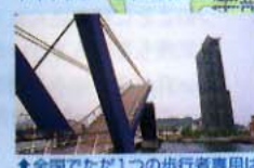
全国でただ1つの歩行者専用はね橋。1日に6回開閉される。