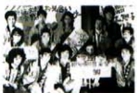
昭和55年第12回船尾祭実行委員の仲間とは、2年に1回のペースで旅行に出かけている。

4回生の時に大学新聞「学園タイムス」を発行したのは、忘れられない思い出だ。パソコンやワープロが普及していなかった当時、自分が書いた原稿が活字になり、それを多くの学生に読んでもらったことが本当に嬉しかった。現在も、年に1度は必ず大学へ足を運び、同窓会10周年・20周年の手伝いをするなど、同窓会とはつねに関わりを持っている。30周年記念式典もまた、いつまでも忘れられない日になることを期待したい。