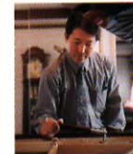
ピアノを調律するには、1mm以下の寸法を指先で感じとれる微妙な感覚が求められる。さまざまな道具を巧みに使い分けながら、ずれた音程やタッチを正確に直す。