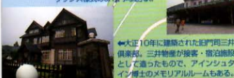
大正10年に建築された旧門司三井倶楽部。三井物産が接客・宿泊施設として造ったもので、アインシュタイン博士のメモリアルルームもある。